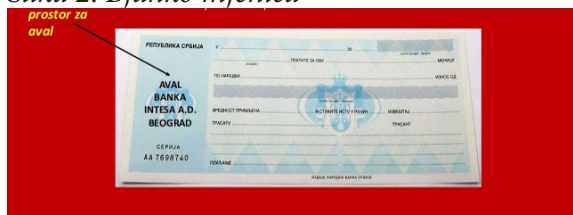
Slika 2. Bjanko mjenica