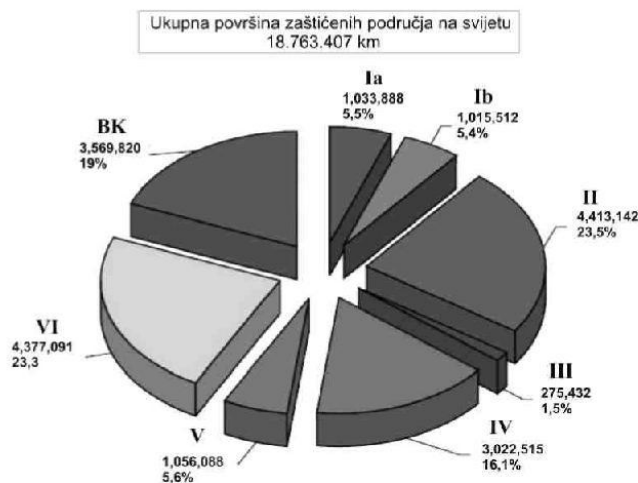
Površina kategorisanih (IUCN) i nekategorisanih zaštićenih područja u odnosu na ukupnu površinu zaštićenih područja na svijetu

Broj i površina zaštićenih prirodnih područja u pojedinim regionima (UN lista zaštićenih područja- IUCN / UNEP World Conservation Monitoring Centre 2003)