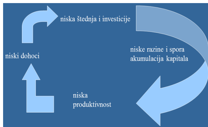
Slika 1: Začarani krug siromaštva

Kako bi se pronašla najbolja metoda za ublažavanje postojeće situacije, svjetska zajednica je najviše pažnje posvećivala „začaranom krugu siromaštva“.